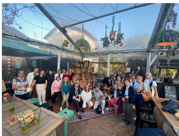
Apéro de rentrée au Gargalou