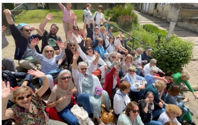
Sortie culturelle à Malagar et Verdélais